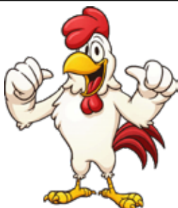
HÜHNER ODER HAHN